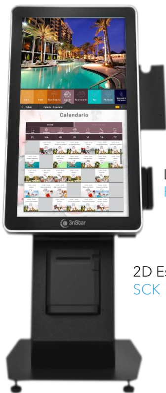
Soporte Para Terminal De Pago K21-PTHolder